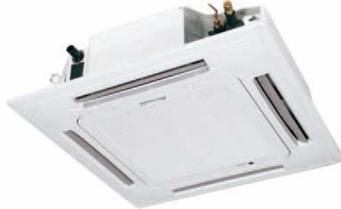
Inneneinheit KXL 24/30/36/45