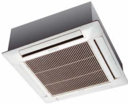
Inneneinheit KN 9/11/15/18