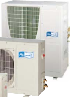
GC 18/24/30 N