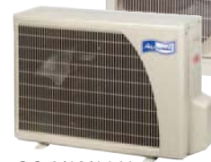
GC 9/12/14 N