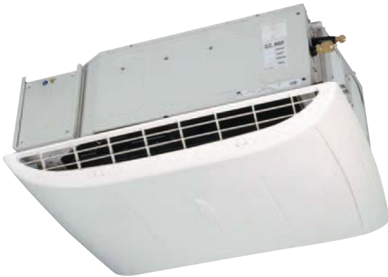
Inneneinheit MD 35/38/50