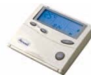
Wandfernbedienung RCW2 Artikelnummer 7ACEL1212 Listpreis € 194,- (näheres siehe Seite 9)