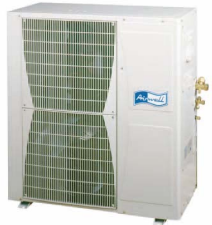
Außeneinheit GCN 36/43