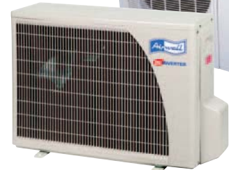
GC 12/18 DCI