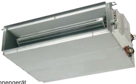
Innengerät BS 12 DCI