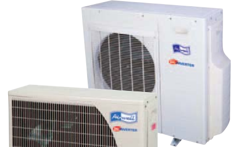
GC 24/30 DCI