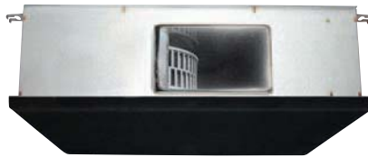
Inneneinheit DLS 18/24/30 DCI