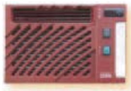
Wine C50S Innenansicht