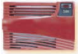
Wine C18 & C18S Innenansicht