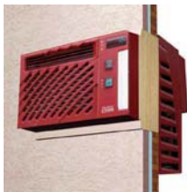
Installationsschemata (nicht maßstabsgetreu)