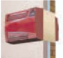
Installationsschemata (nicht maßstabsgetreu)