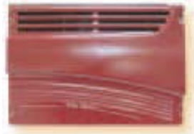
Wine C18 & C18S Außenansicht