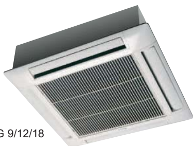
K OG 9/12/18