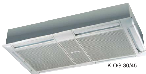
K OG 30/45