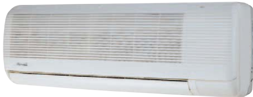
XLM OG 7/9