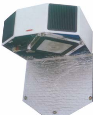
WRG Compact 800

Die Wärmerückgewinnungsgeräte der Serie WRG-Compact sind mit einem Plattenwärmetauscher und einem elektrischem Nachheizregister ausgestattet. Die Geräte sind für Wandmontage vorgesehen. Die Serie WRG-Compact benötigt nur zwei Kernbohrungen \varnothing 150 mm nach Aussen. Aufgrund ihrer geringen Abmessungen eignet sich die Serie WRG-Compact besonders für Gaststätten, Cafe`s und Imbissstuben.