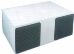
WRG Compact 400