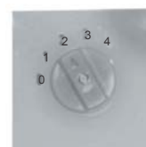
C10 .. UP